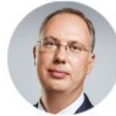
Дмитриев Кирилл Российский фонд прямых инвестиций (РФПИ), Генеральный директор;